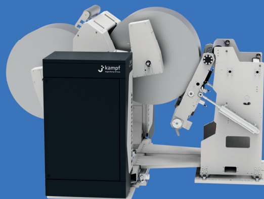
Wendeabwickler mit Auto Splice